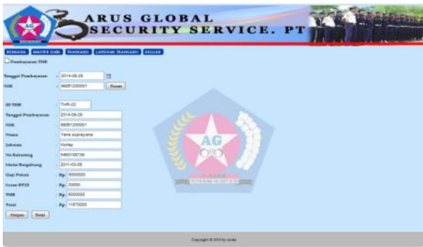
Gbr. 8 Halaman Transaksi Untuk Tunjangan THR