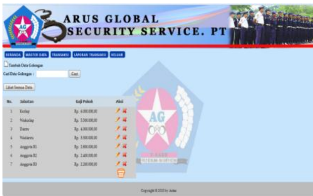
Gbr.3 Master Data Golongan