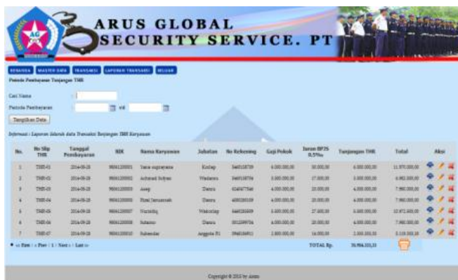
Gbr.11 Halaman Laporan Transaksi Untuk Tunjangan THR