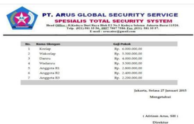
Gbr.13 Halaman Cetak Master Data Golongan