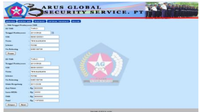
Gbr.12 Halaman Edit Transaksi Tunjangan THR