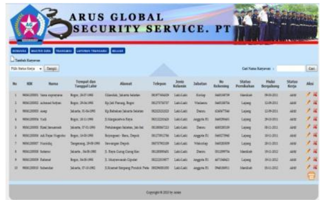
Gbr. 5 Halaman Master Data Karyawan