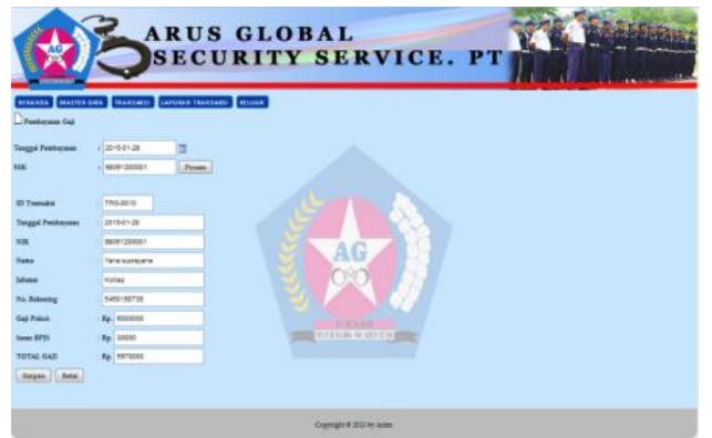
Gbr.7 Halaman Transaksi Untuk Penggajian