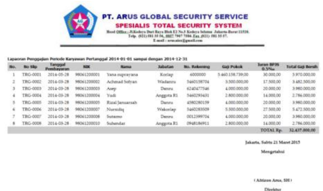
Gbr.15 Cetak Laporan Penggajian