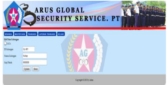
Gbr. 4 Halaman Edit Data Golongan

Sistem Informasi Penggajian ini adalah sebuah sistem yang mempermudah bagian keuangan dalam memproses pengajian karyawan dan membuat laporan penggajian. Berikut ini bentuk interface dari sistem informasi penggajian karyawan pada PT Arus Global Security Service Jakarta.