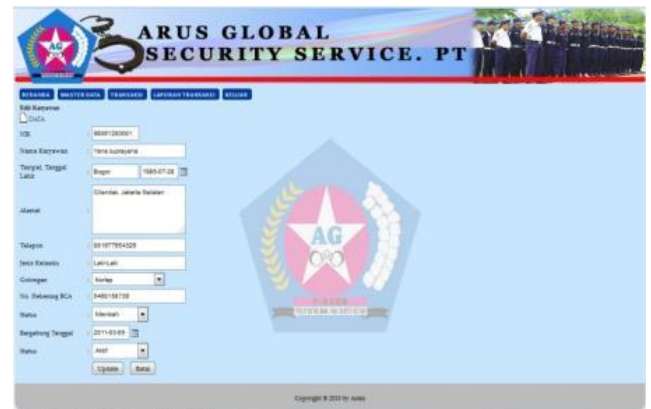
Gbr 6. Halaman Edit Data Karyawan