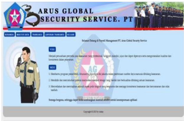
Gbr.2 Tampilan Halaman Utama