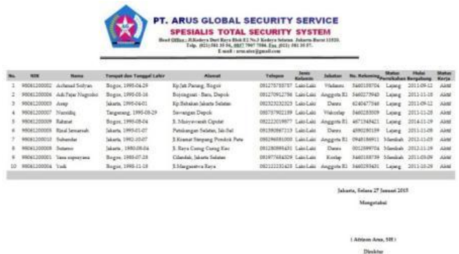
Gbr.14 Halaman Cetak Master Data Karyawan