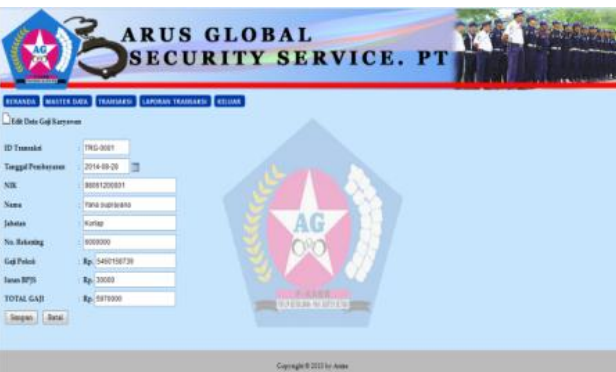
Gbr. 10. Halaman Edit Transaksi Penggajian